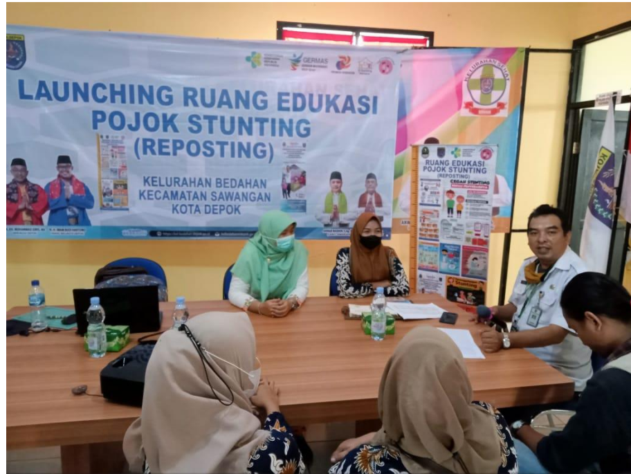
Gambar 3 Konseling Stunting

Pada Ruang edukasi pojok stunting terdapat konseling stunting. Konseling stunting adalah proses bantuan yang diberikan oleh seorang profesional kesehatan mental untuk membantu orang tua dan anak-anak yang mengalami stunting. Konseling ini dapat membantu orang tua mengidentifikasi dan mengatasi masalah yang mungkin menyebabkan stunting, seperti masalah nutrisi, kurangnya akses ke layanan kesehatan, dan masalah sosial. Konseling juga dapat membantu orang tua meningkatkan keterampilan mereka dalam mengelola masalah yang mungkin menyebabkan stunting, seperti meningkatkan keterampilan komunikasi dan pengambilan keputusan.