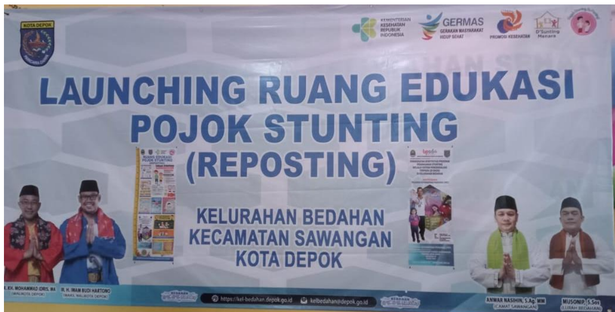
Gambar 1 Launching Ruang Edukasi Pojok Stunting

Ruang edukasi pojok stunting adalah ruang yang dibuat untuk meningkatkan kesadaran masyarakat tentang masalah stunting. Ruangan ini dapat berisi informasi tentang apa itu stunting, bagaimana menghindarinya, dan bagaimana mengatasinya. Serta berisi informasi tentang makanan sehat, olahraga, dan gaya hidup yang dapat membantu mencegah stunting. Kemudian ruangan ini juga dapat berisi informasi tentang program-program pemerintah yang dapat membantu mencegah stunting dan dapat berisi informasi tentang cara-cara untuk mengajak orang lain untuk berkontribusi dalam mengurangi stunting.