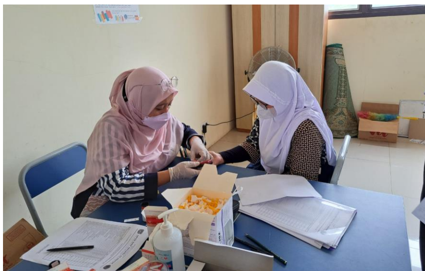
Gambar 2 Pelayanan Stunting